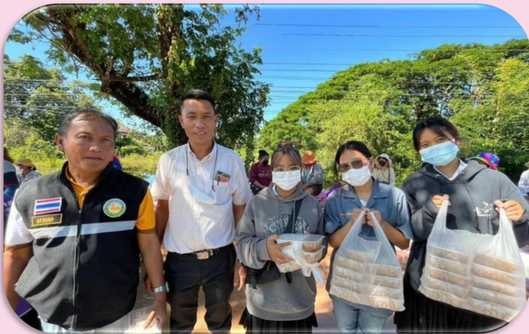
เครื่องปรุงอาหารในครั้งนี้ด้วย

อาจารย์ นิสิต คณะเทคโนโลยี มหาวิทยาลัยมหาสารคามสาขาพัฒนาผลิตภัณฑ์อาหารชั้นปีที่ 2-4 แจก อาหารผู้ประสบอุทกภัย ในพื้นที่จังหวัดมหาสารคาม